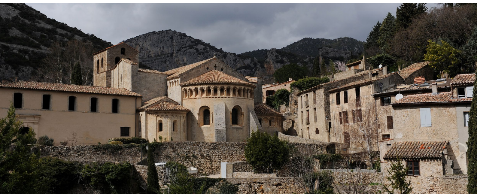
Abbaye de Gellone, Saint-Guilhem-le-désert (Hérault)