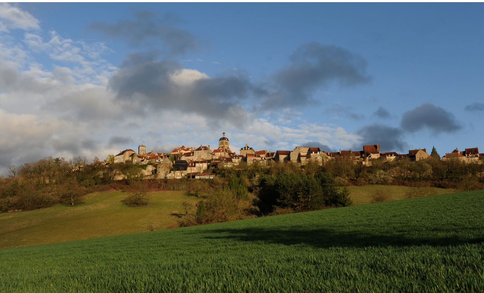
Départ du chemin Via Lemovicensis, Vézelay