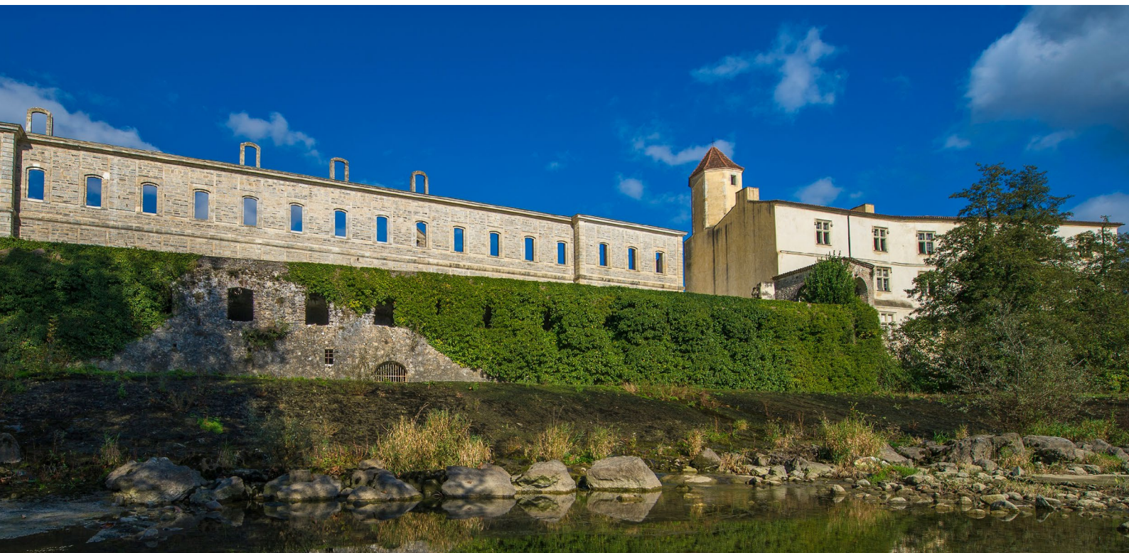
Ancienne abbaye de Sorde (Landes)

Pour en savoir plus : http://whc.unesco.org/fr/