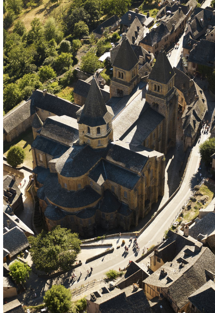
CONQUES. Vue aérienne

Les échanges culturels et les influences artistiques sont une conséquence de la circulation sur les routes médiévales,