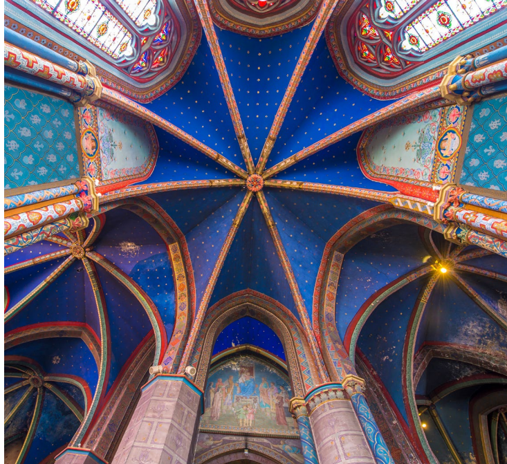
Eglise Sainte-Marie, Oloron (Pyrénées-Atlantiques)