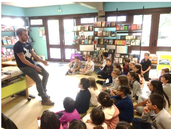
Exemple d'intervention d'un doctorant autour de la BD, en bibliothèque, dans le cadre de « La science se livre » en 2017.

Les supports numériques des illustrations seront mis à disposition des universités qui pourront, à leur charge, en faire une réimpression sous le format de leur choix (fascicule, exposition panneaux...) et les utiliser comme outils de médiation.